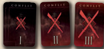
4 cartes Conflit