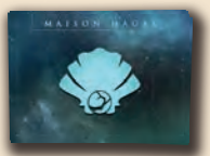
9 cartes Maison Hagal

Utilisé uniquement lors d'une partie en Solo ou à Deux Joueurs