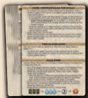
2 cartes de référence Rival