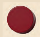
1 disque jeton Cargo