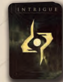
17 cartes Intrigue