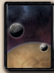
35 cartes Imperium

Utilisés avec la Dirigeante Tessia Vernius