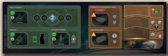
Plateau de la CHOM (à superposer)