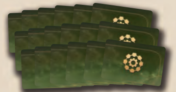
18 tuiles Technologie